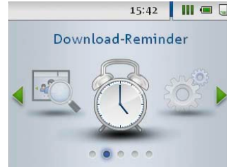
Erinnerung an anstehende Downloads