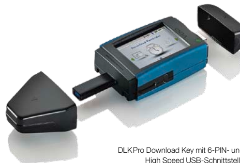
DLK Pro Download Key mit 6-PIN- und High Speed USB-Schnittstelle

Bestell-Nr. DLK Pro Download Key: A2C59514502 Bestell-Nr. DLK Pro Licence Card: A2C59514674 Bestell-Nr. DLK Pro Power Box: A2C59514675 Bestell-Nr. DLK Pro Neoprene Case: A2C59514917